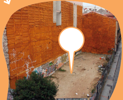
Terreny on construir