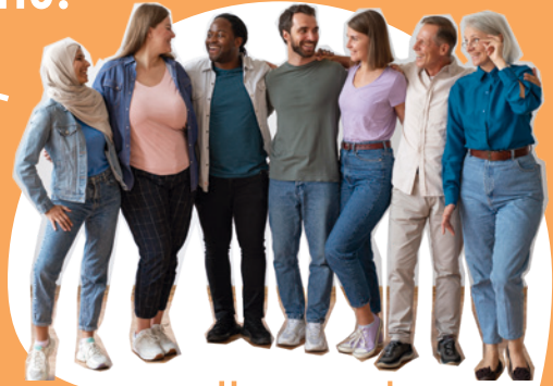
Un grup de gent